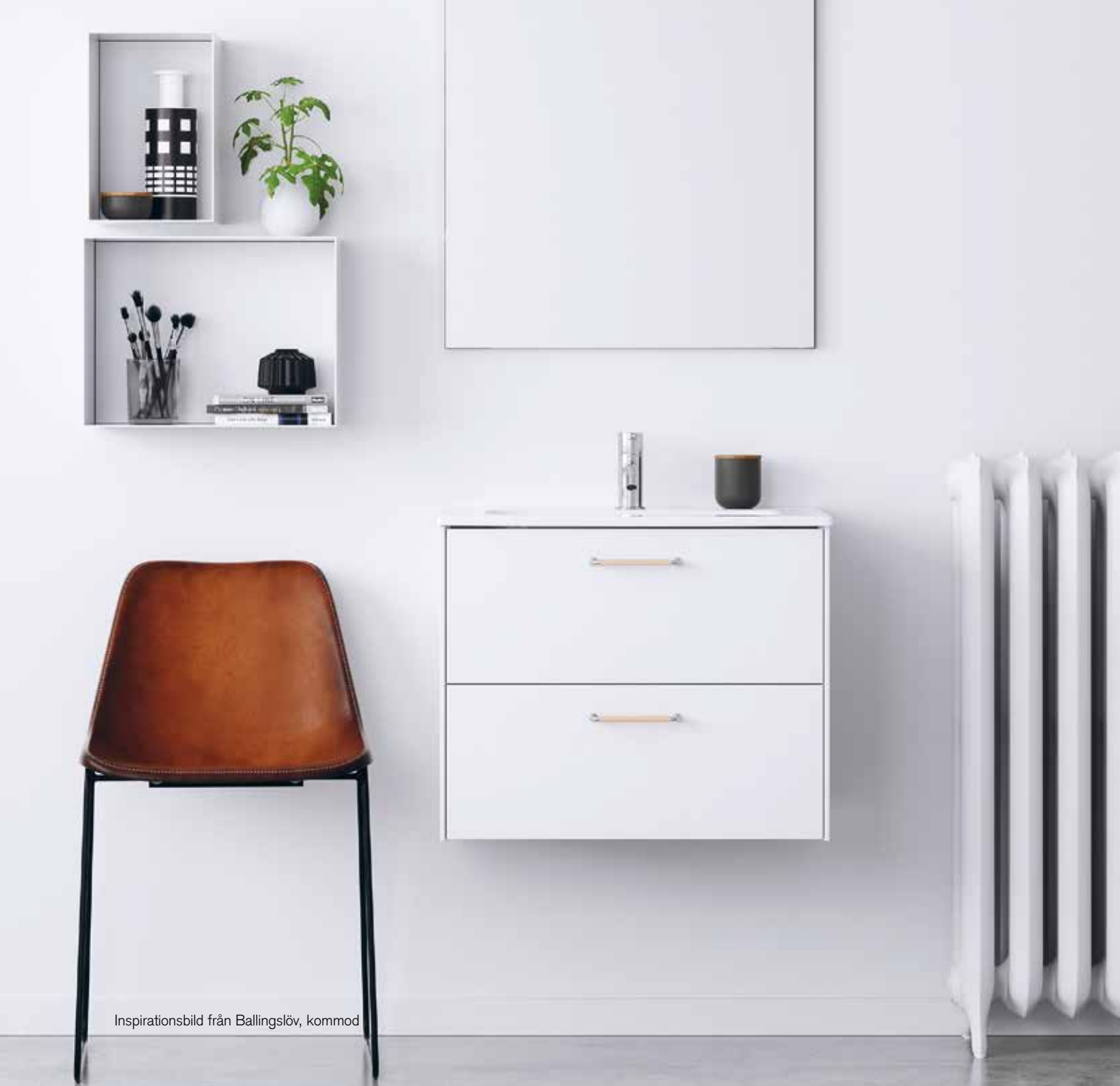
Inspirationsbild från Ballingslöv, kommod