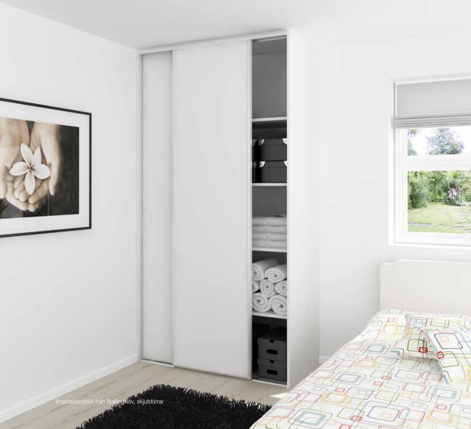
Inspirationsbild från Ballingslöv, skjutdörrar