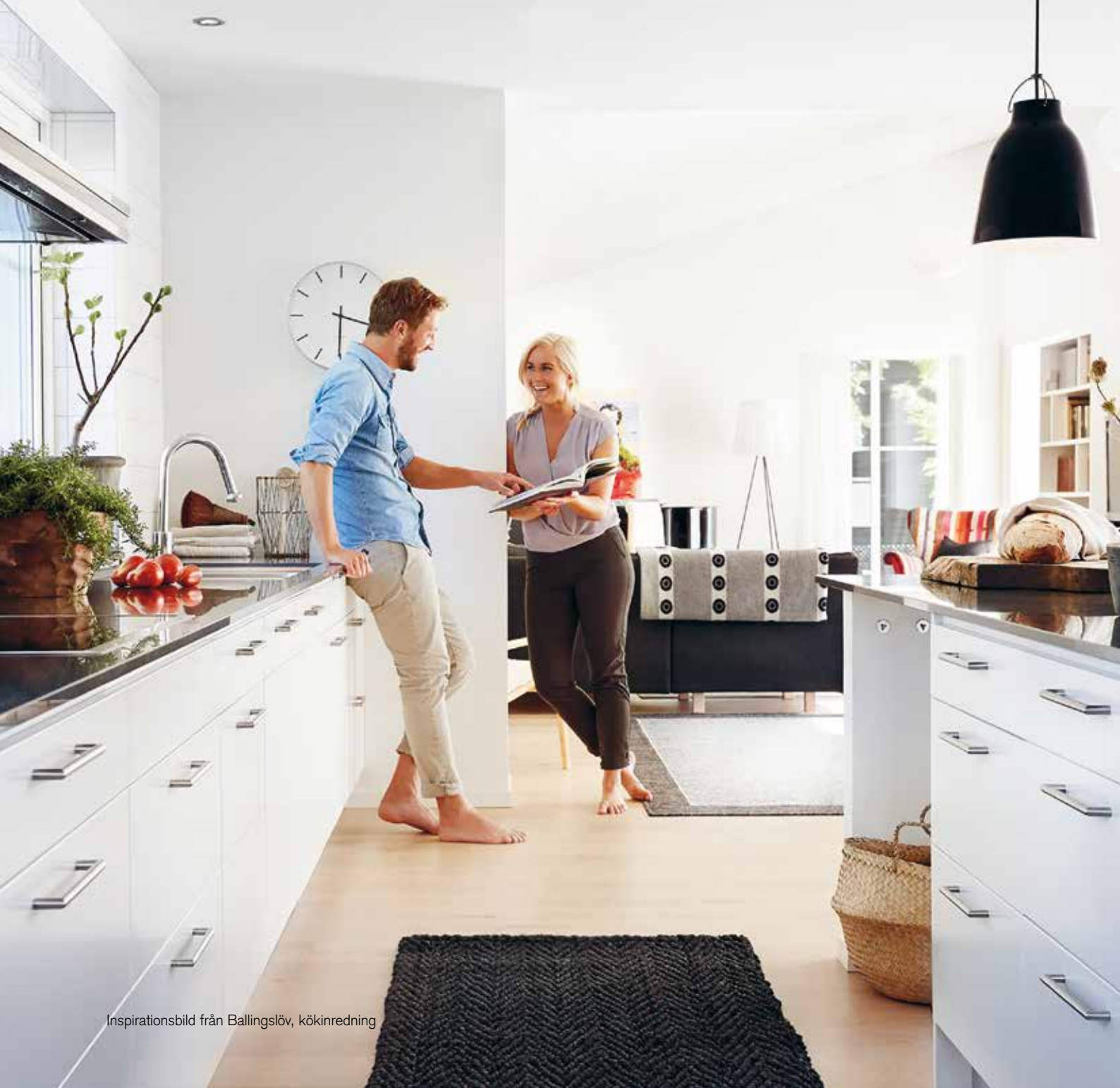
Inspirationsbild från Ballingslöv, kökinredning